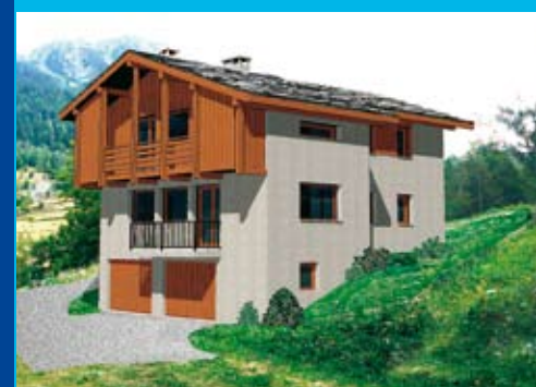
6 e projet imposé par l'ABF et permis de construire