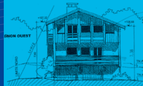
7 e projet notre proposition après obtention du PC