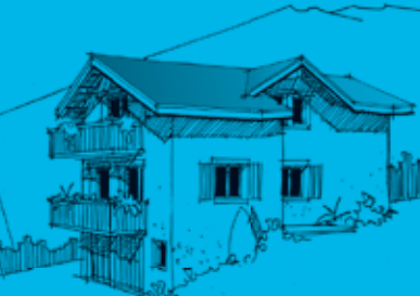
3 e projet plus proche du budget et de l'environnement