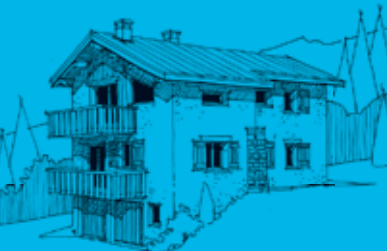
4 e projet modification après consultation

Il est bon de faire comprendre à tous ceux qui vont construire leur maison quelles seront demain les étapes à franchir et les compétences qu'il sera nécessaire de réunir pour aboutir à un projet cohérent, compatible avec leurs attentes, leur budget, accepté par «les parties prenantes environnementales» et entériné par les autorités administratives.