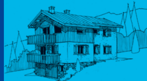
5 e projet après 2 e consultation

Mais une chose est certaine, constructeurs nous sommes et constructeurs nous le resterons.